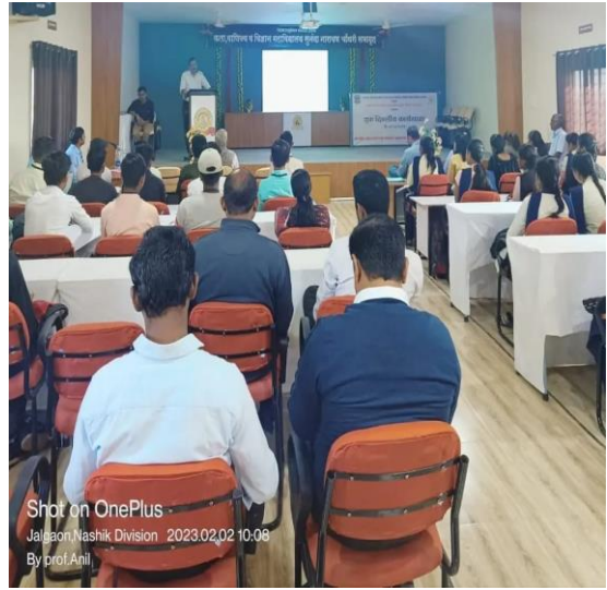
Lecture by Resource person