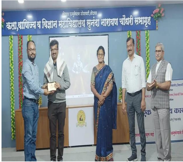
Inauguration of Workshop