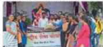
विद्यार्थ्यांनी केले निर्माल्याचे संकलन.

बोदवडला येथील एनएसएस विद्यार्थ्यांनी आज दिवसभराने एनएसएस एककाच्या अखत्यारीत येथील विद्यार्थ्यांनी केले निर्माल्याचे संकलन. या उपक्रमाने येथील विद्यार्थ्यांनी केले निर्माल्याचे संकलन. या उपक्रमाने येथील विद्यार्थ्यांनी केले निर्माल्याचे संकलन.