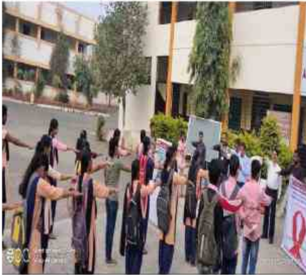
Aids Awareness – 13/08/2019