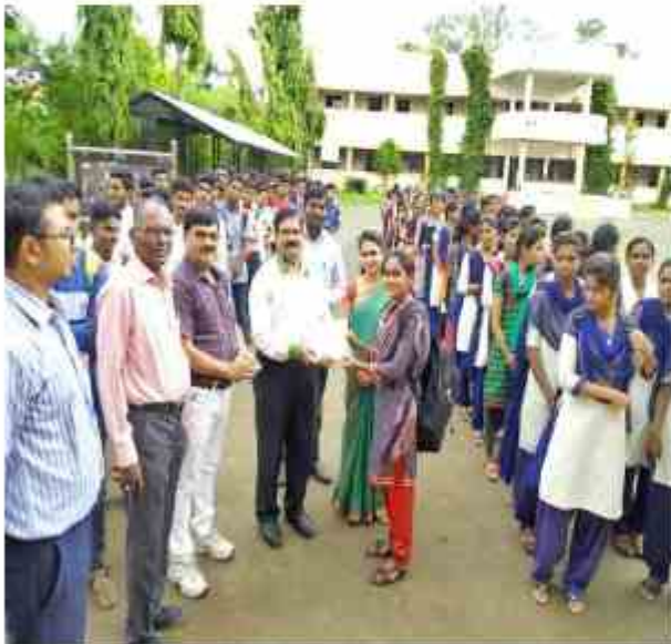
Voters Awareness – 18/09/2019