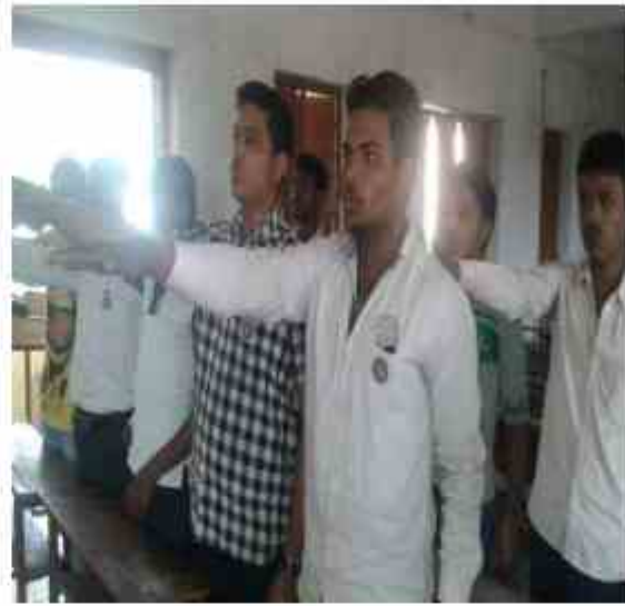
No Tobacco Oath – 11/07/2019