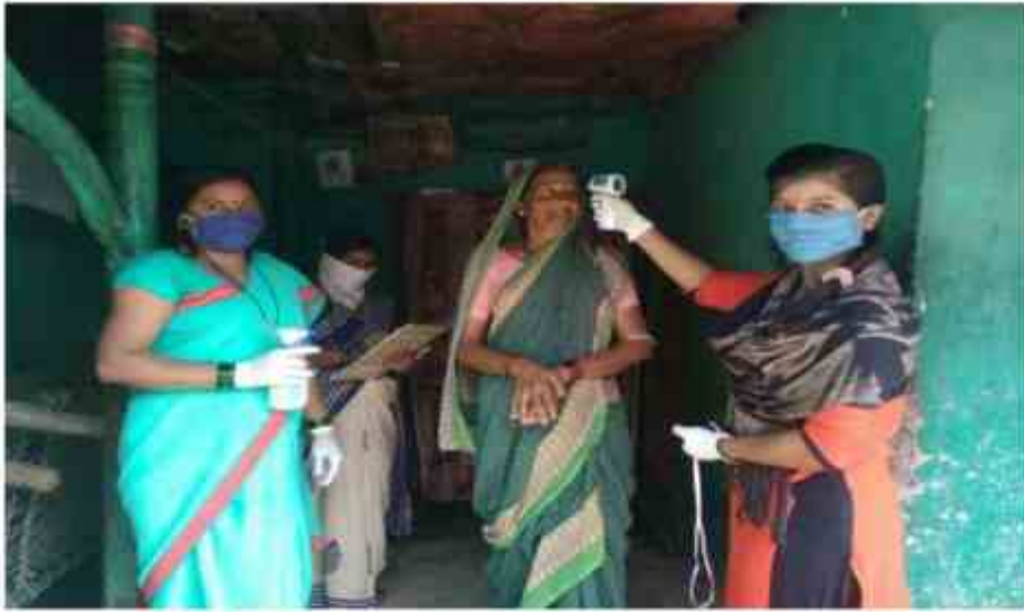
Gandagi Mukta Campaign – 8-15/08/2020