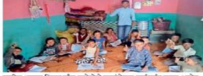
ग्रामीण भागात विद्यार्थ्यांना रासेयोचे स्वयंसेवक मार्गदर्शन करत आहेत.