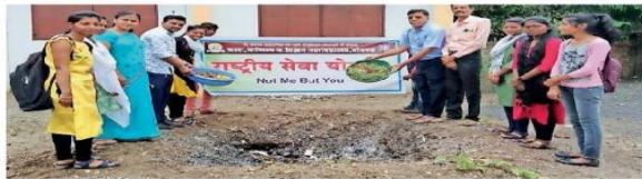
बोदवड महाविद्यालयात निर्माल्याचे विघटन करताना रासेयो स्वयंसेवक.